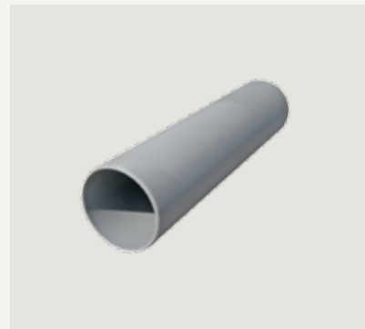
Anslutningsrör frånluft, 45 cm