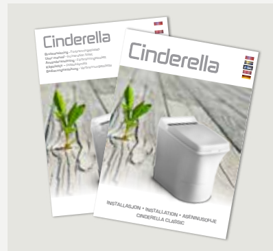
Installations- och användaranvisning