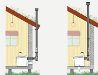
Installation av Cinderella Classic och Gas