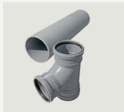
Anslutningsrör frånluft, 45 cm och T-rör