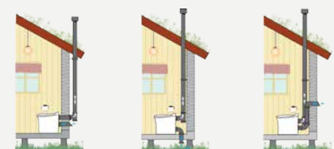
Installation av Cinderella Comfort