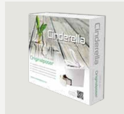
500 st papperspåsar