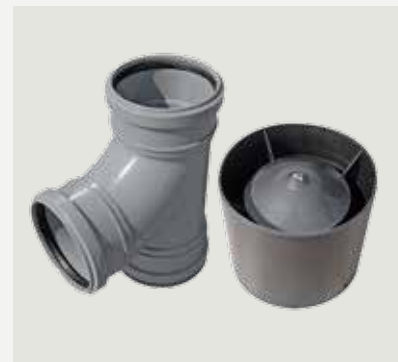
T-rör och regnhatt