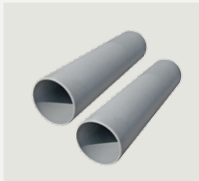
Anslutningsrör till- och frånluft, 45 cm