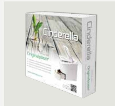
500 st papperspåsar