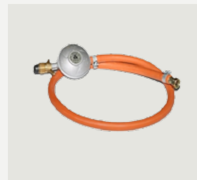
Gasslang och regulator